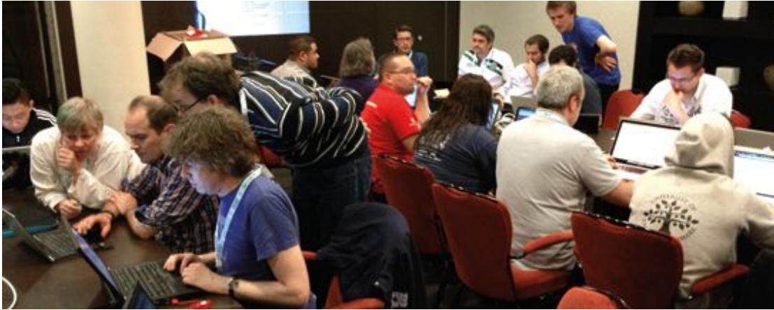
Bug Squad Team im Einsatz