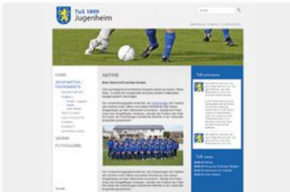
TUS Jugenheim - Sportverein