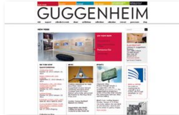
The Guggenheim Museums and Foundation