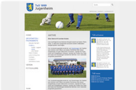
TUS Jugendheim - Sportverein