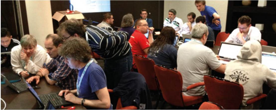
Bug Squad Team im Einsatz