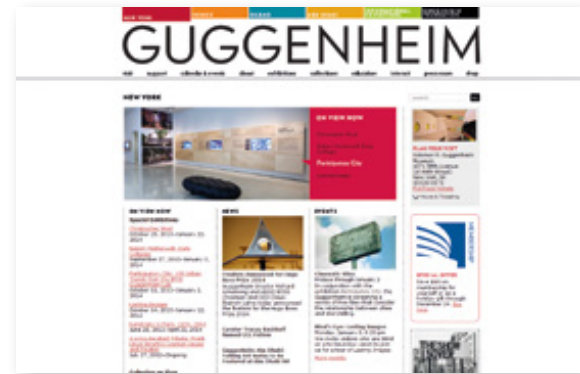
The Guggenheim Museums and Foundation